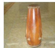
Gambar 3: Ketipung

Ketiga, Ketipung. Berasal dari bahasa Arab “ katifun ” yang berarti : balasan (Munawwir, 1984: 1281). Manusia harus hati-hati dengan setiap perbuatan yang dilakukannya, karena semuanya harus dipertanggungjawabkan di hadapan Tuhan dan akan memperoleh balasan yang setimpal di pengadilan akhirat nanti. Oleh karena itu harus diupayakan agar semua perbuatannya baik dan sesuai dengan tuntunan agama.