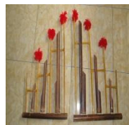
Gambar 5: Angklung

Keenam, Angklung. Berasal dari bahasa Arab “ intiqaal ”, yang berarti: bergerak, berhijrah (Munawwir, 1984: 1557). Manusia harus senantiasa melakukan hijrah (bergerak/berpindah) dari keburukan/kejahatan (melanggar aturan, norma, ketaatan) menuju kepada kebaikan (terpuji).