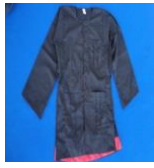
Gambar 8: Baju Penadon

Kesebelas, Udheng. Berasal dari bahasa Arab “ ud’u ” yang berarti: mengajak, menganjurkan (Munawwir, 1984: 439). Manusia harus saling mengajak, saling menganjurkan melalui doa dan dakwah. QS. Al-‘Ashr : 1-3: “ Demi masa. Sesungguhnya manusia akan mengalami kerugian, kecuali orang-orang yang beriman, beramal salih, saling menasihati dalam hal kebaikan dan saling menasihati dalam hal kesabaran. ”