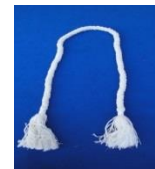
Gambar 7: Kolor/usus-usus

Kesembilan, Kolor/Usus-usus. Berasal dari bahasa Arab “ ususun ” yang berarti: dasar, landasan (Munawwir, 1984: 26). Agar hidup manusia sempurna, maka ia harus memegang erat tali Allah ( hablun min Allah ) dengan ketataan/pengabdian yang sempurna. Bersamaan dengan itu, manusia juga harus memegang tali untuk membangun hubungan antar sesama ( hablun min al-nas ), hubungan dengan sesama manusia. Kedua tali (vertical dan horizontal) ini menjadi syarat manusia akan menjadi insan kamil (manusia yang sempurna/mulia).