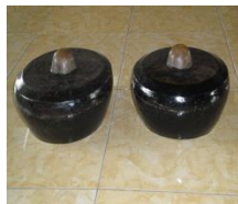
Gambar 4: Kenong dan Kethuk

Kelima, Kethuk. Berasal dari bahasa Arab “ khatha ” yang berarti : salah (Munawwir, 1984: 376). Manusia harus menyadari sepenuhnya, bahwa sebaik apapun manusia, mestilah ia akan berbuat kesalahan/dosa. Karena itu sebaik-baik manusia, bukanlah orang yang tidak bersalah/berdosa, karena hal itu tidak mungkin, tetapi manusia yang baik adalah orang yang melakukan kesalahan/dosa kemudian segera bertaubat kepada Allah.