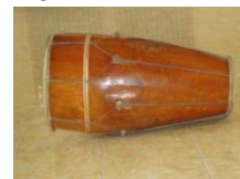
Gambar 2: Kendang

Kedua, Kendang. Berasal dari bahasa Arab “ qada’a ” yang berarti : mengendalikan (Munawwir, 1984: 1179). Manusia harus pandai mengendalikan hawa nafsunya agar tidak terjerumus ke dalam perbuatan yang tercela, melanggar aturan/norma agama, merugikan orang lain, dan seterusnya.