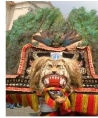
Gambar 1: Reyog/Dhadhak Merak

sebenar-benar taqwa dan janganlah sekali-kali kamu mati, kecuali dalam keadaan memeluk Islam ”.